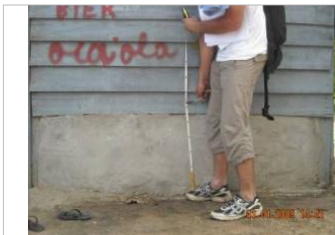
Vue du support et de la mesure du niveau des PHE