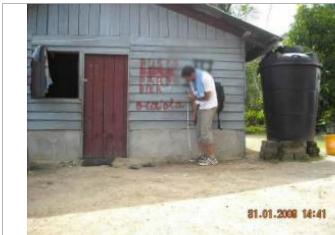
Vue globale du bâtiment

Coordonnées WGS84 : X: -54.41308000 / Y: 4.39556900