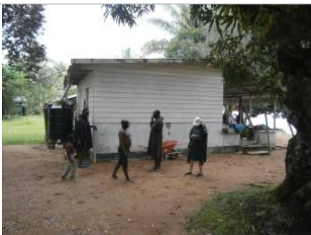
Vue du support de la mesure

Différence entre le niveau d'eau et la référence (en m) : 0.330 m