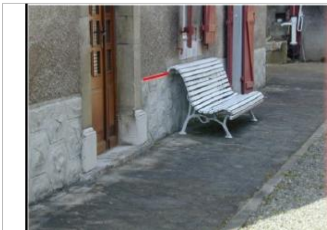
Vue globale du bâtiment