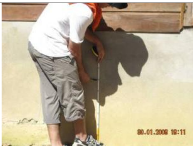
Vue du support et de la mesure du niveau des PHE