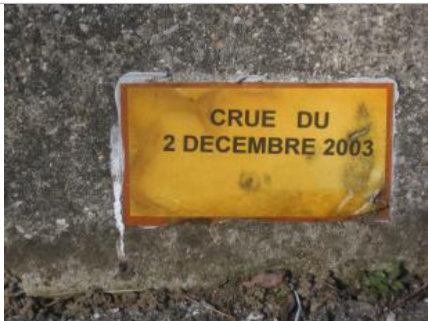
Repère de crue avec ancienne plaque plastique