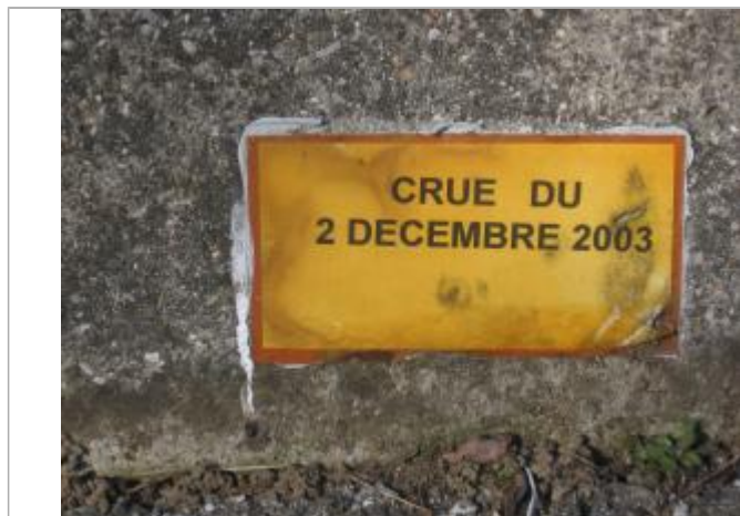
Repère de crue avec ancienne plaque plastique