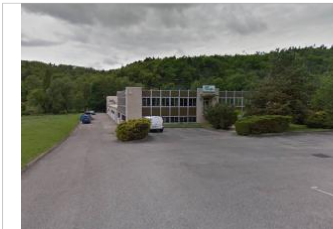
ZI Les Près du Roy - accès à l'arrière de l'entreprise (AC+)