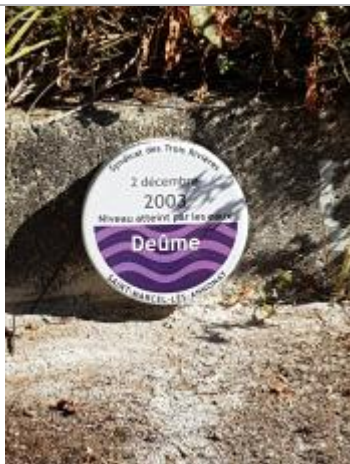
Repère de crue, jour de pose