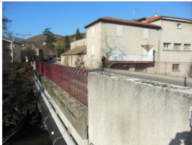
Pont situé en aval immédiat de l'ancienne usine Canson