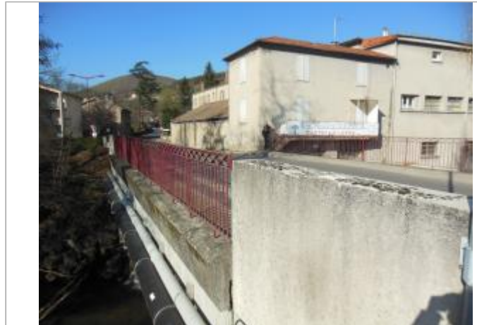
Pont situé en aval immédiat de l'ancienne usine Canson