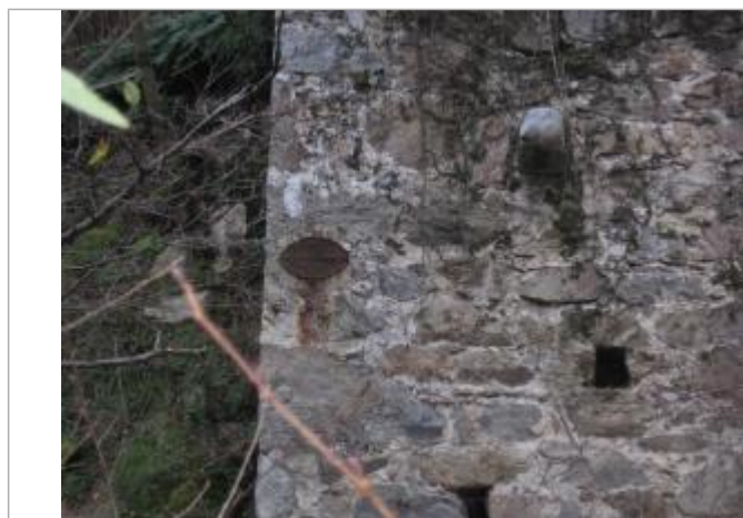
Repère de crue sur arche restant d'un ancien pont - situé sur rive droite de la Cance et sur commune de Roiffieux