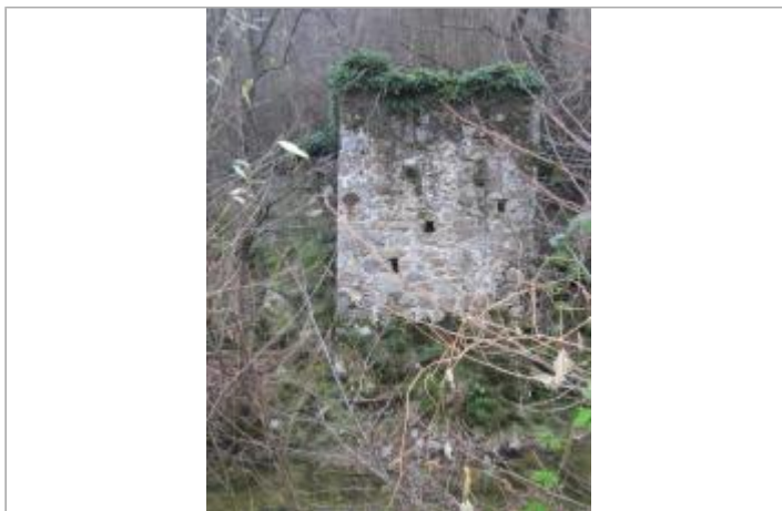
Ancien arche de pont en rive droite de la Cance situé sur la commune de Roiffieux