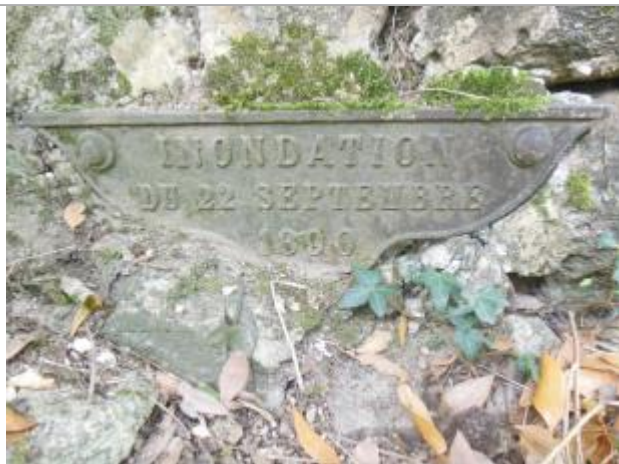
Plaque métallique sur muret en pierre (propriété privée)

NIVELLEMENT EFFECTUÉ PAR L'IGN EN 1979 - FICHE REPERE DE CRUE DISPONIBLE SUR SITE DES REPERES GÉODÉSIQUES - 29/09/2017