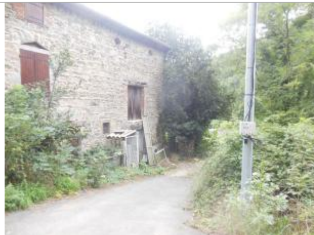
Façade d'habitation avec repère de crue sur le muret et repère géodésique IGN