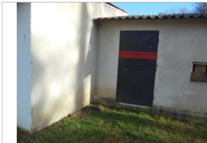
Trace d'humidité au-dessus du seuil de la porte