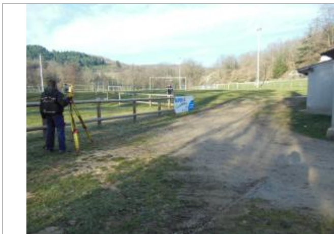
Vue du stade de Grusse (laisse d'inondation sur les bâtiments à droite)