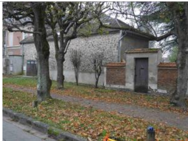
Garage contenant les repères

Coordonnées WGS84 : X: 2.44464950 / Y: 48.64561600