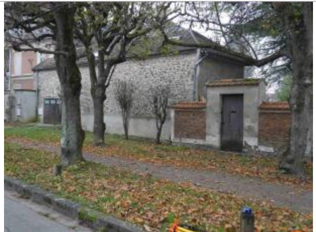
Garage contenant les repères

Coordonnées WGS84 : X: 2.44464950 / Y: 48.64561600