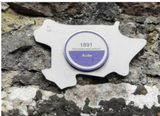
repere de 1891

Altitude calculée de l'eau (en m) : 203.3 m