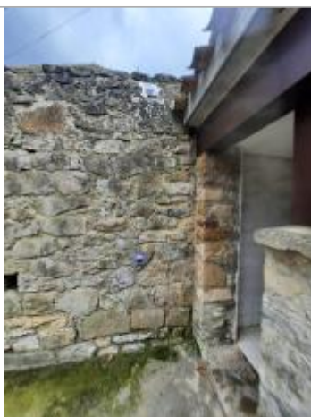
le repere de 1992 est celui situé le plus bas