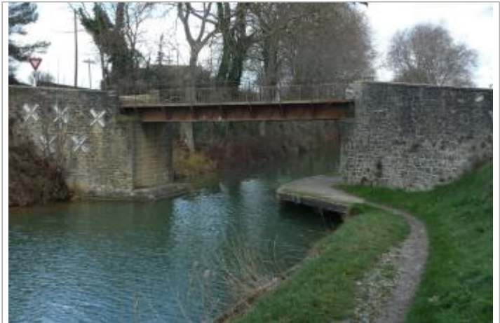
Pont Rouge sur le canal du Midi à Carcassonne