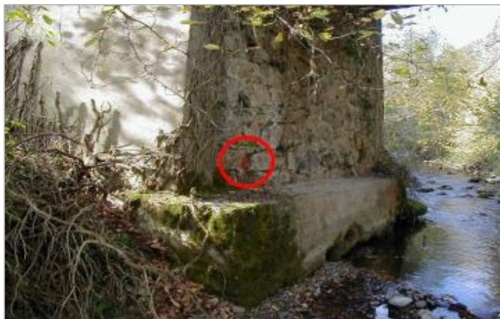
Pont des massols - culée droite intérieure - aval

Coordonnées WGS84 : X: 2.11245660 / Y: 42.83130800