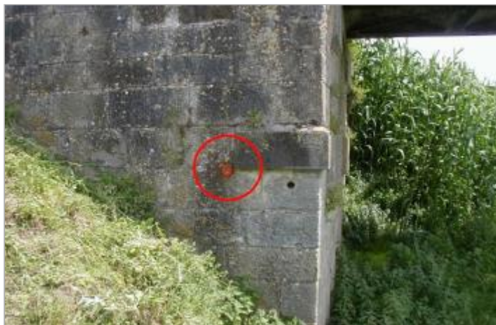
culée droite - aval