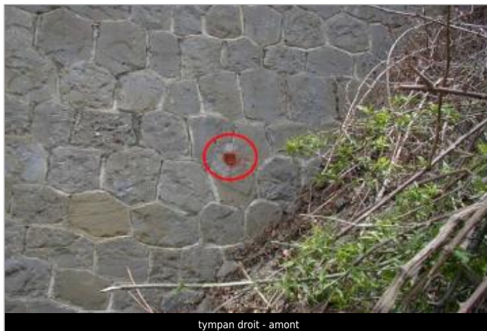
tympa droit - amont

Coordonnées WGS84 : X: 2.31354790 / Y: 43.12145100 Coordonnées RGF93 (Lambert 93) X: 644094.12 / Y: 6224930.4 Coordonnées RGF93 (ETRS89) : X: 2.3135479 / Y: 43.121451 Code Hydro: Y1220500 Rive de référence: Non renseigné