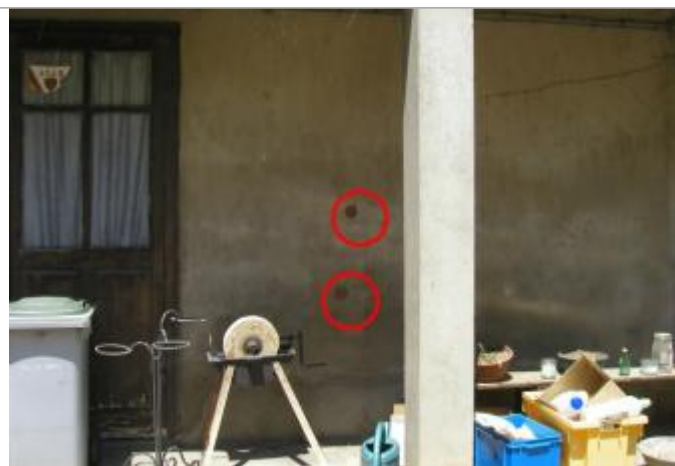
façade intérieure rive gauche

Altitude calculée de l'eau (en m) : 163.8 m