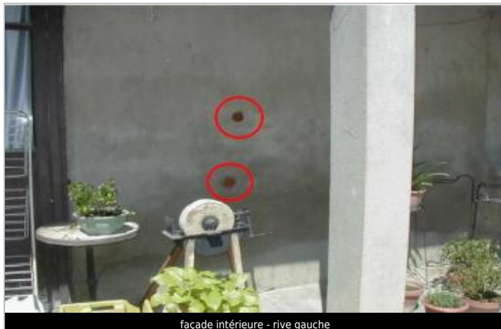
façade intérieure - rive gauche