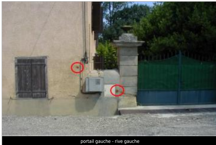
portail gauche - rive gauche