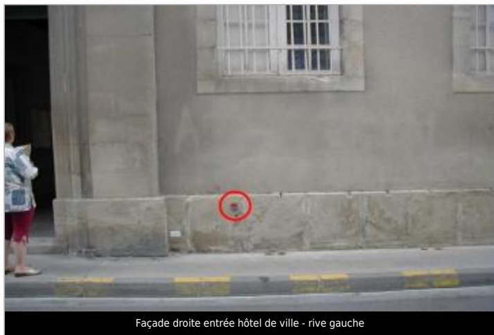
Façade droite entrée hôtel de ville - rive gauche

GÉOLOCALISATION Coordonnées WGS84 : X: 2.21830390 / Y: 43.05301800 Coordonnées RGF93 (Lambert 93) X: 636262.2 / Y: 6217394.24 Coordonnées RGF93 (ETRS89) : X: 2.2183039 / Y: 43.053018 Code Hydro: Y1--0200 Rive de référence: Gauche