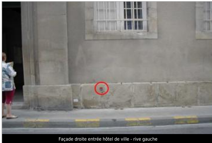
Façade droite entrée hôtel de ville - rive gauche