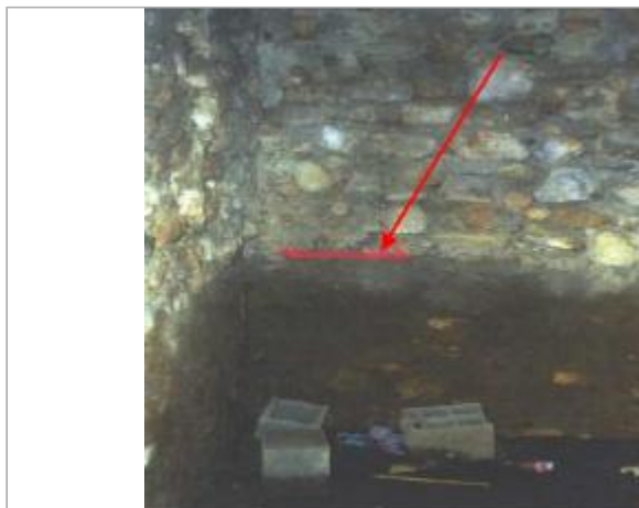
mur intérieur de la bâtisse - rive droite

Coordonnées WGS84 : X: 2.91410760 / Y: 43.05249300