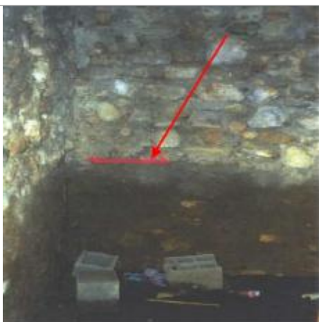
mur intérieur de la bâtisse - rive droite