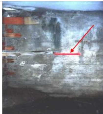
mur intérieur de la bâtisse - rive droite

Coordonnées WGS84 : X: 2.87678160 / Y: 43.04995000