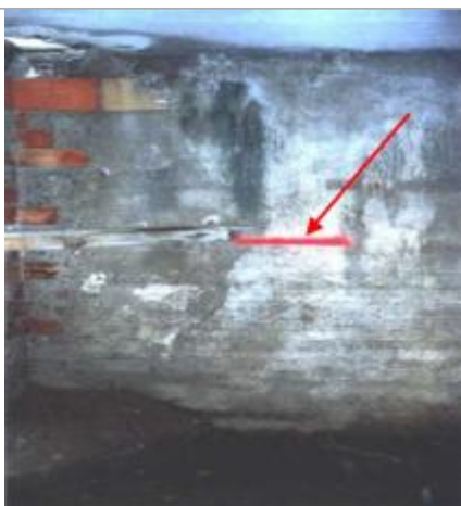
mur intérieur de la bâtisse - rive droite