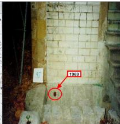
angle droit de porte de chapelle.- rive droite