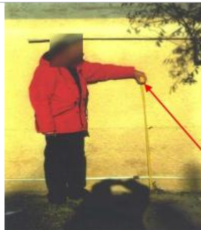
mur d'enceinte du camping - rive droite - trace de limons - ancien lit de la Berre