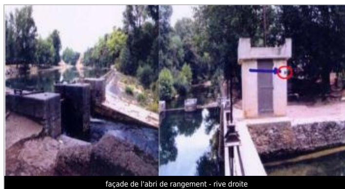
façade de l'abri de rangement - rive droite

GÉOLOCALISATION Coordonnées WGS84 : X: 2.89190300 / Y: 43.28572800 Coordonnées RGF93 (Lambert 93) X: 691221.28 / Y: 6242956.59 Coordonnées RGF93 (ETRS89) : X: 2.891903 / Y: 43.285728 Code Hydro: Y1600500 Rive de référence: Droite