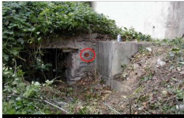
Piédroit de l'entrée - rive gauche. robinetterie en ruines contiguë à la micro-centrale.