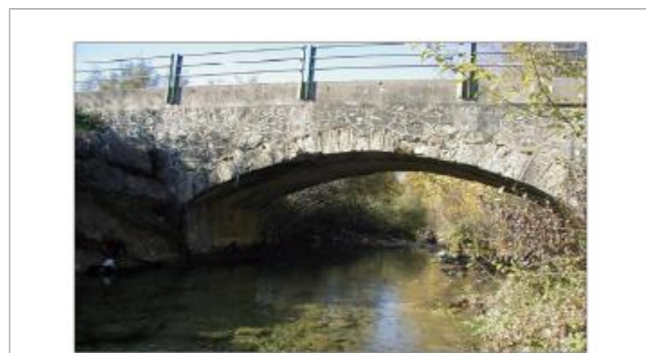
Des travaux anciens réalisés sur les parois des culées de ce pont, seraient la cause de la disparition de ce repère.

GÉNÉRAL Code : DDTM11_R_971_1 Date de mise à jour : 13/09/2017 Auteur : DDTM 11