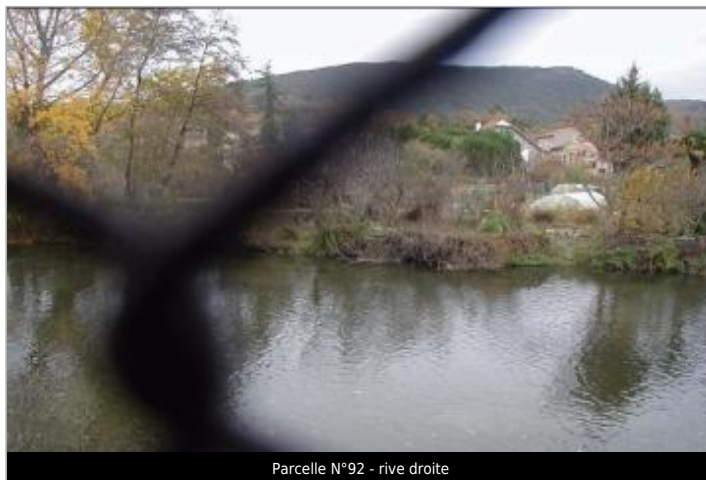
Parcelle N°92 - rive droite