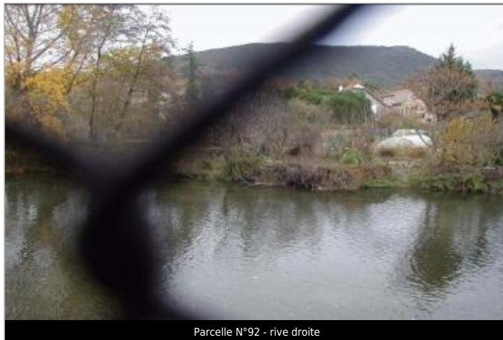
Parcelle N°92 - rive droite