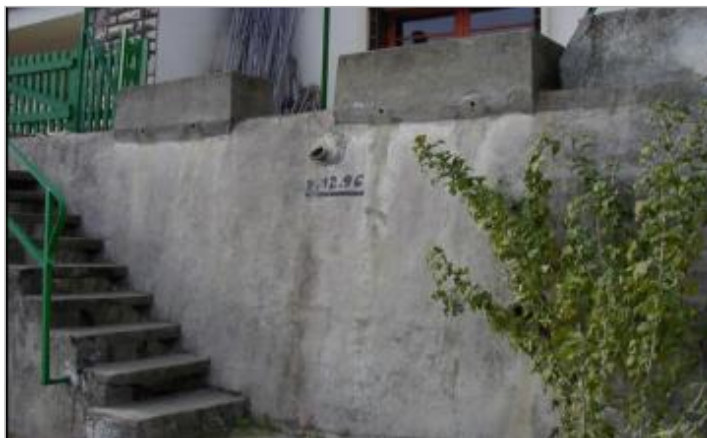
mur de soutènement - rive gauche - Lieux réhabilités