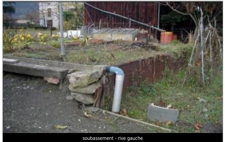
soubassement - rive gauche

Coordonnées WGS84 : X: 2.18438830 / Y: 42.86902400