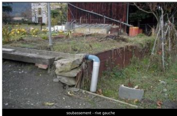
soubassement - rive gauche

GÉOLOCALISATION Coordonnées WGS84 : X: 2.18438830 / Y: 42.86902400 Coordonnées RGF93 (Lambert 93) X: 633285.57 / Y: 6196963.94 Coordonnées RGF93 (ETRS89) : X: 2.1843883 / Y: 42.869024 Code Hydro: Y1--0200 Rive de référence: Gauche