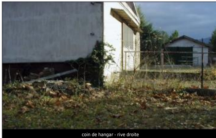
coin de hangar - rive droite