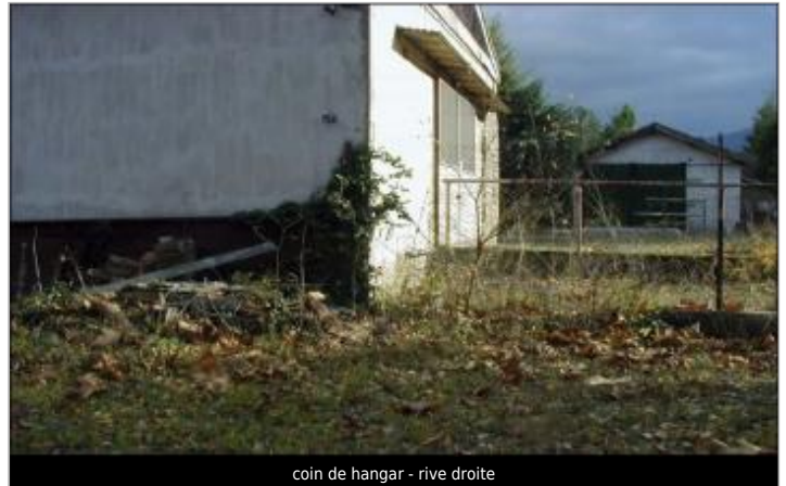
coin de hangar - rive droite

Coordonnées WGS84 : X: 2.18443360 / Y: 42.86672900