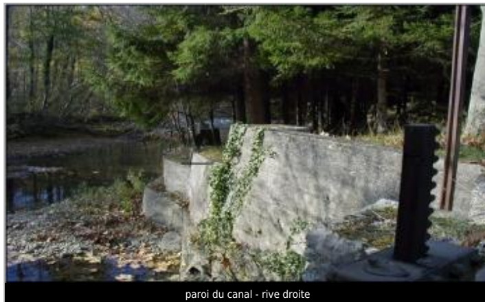
paroi du canal - rive droite