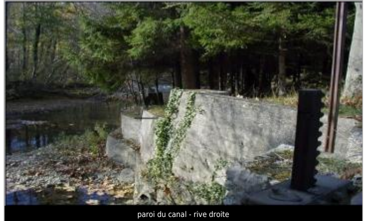
paroi du canal - rive droite