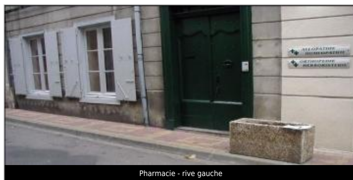
Pharmacie - rive gauche

GÉOLOCALISATION Coordonnées WGS84 : X: 2.18443790 / Y: 42.87620200 Coordonnées RGF93 (Lambert 93) X: 633297.87 / Y: 6197762.09 Coordonnées RGF93 (ETRS89) : X: 2.1844379 / Y: 42.876202 Code Hydro: Y1--0200 Rive de référence: Gauche