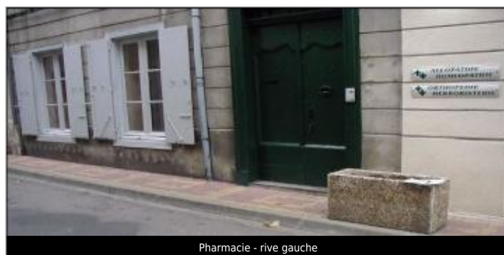
Pharmacie - rive gauche

GÉOLOCALISATION Coordonnées WGS84 : X: 2.18443790 / Y: 42.87620200 Coordonnées RGF93 (Lambert 93) X: 633297.87 / Y: 6197762.09 Coordonnées RGF93 (ETRS89) : X: 2.1844379 / Y: 42.876202 Code Hydro: Y1--0200 Rive de référence: Gauche