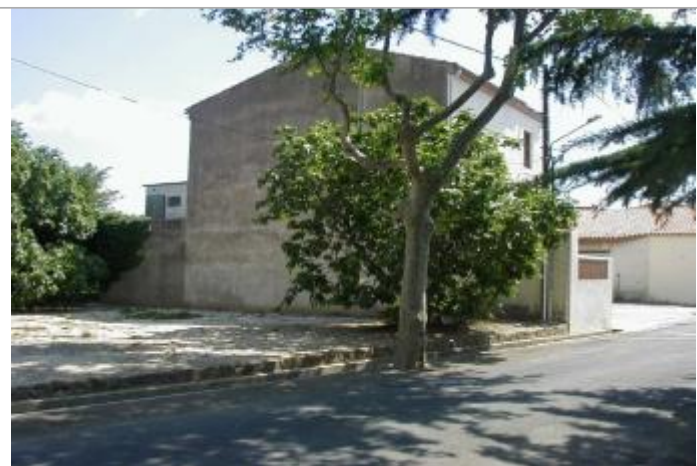
Façade de maison - repère disparu

Altitude calculée de l'eau (en m) : 132 m