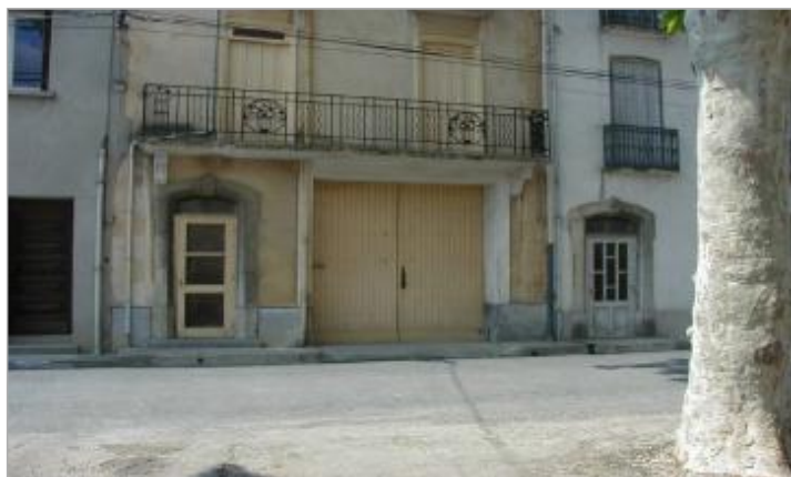
Façade de maison - repère disparu