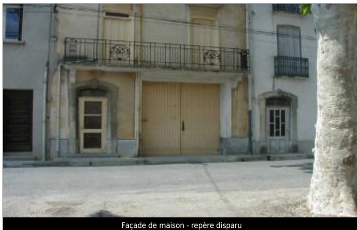
Façade de maison - repère disparu