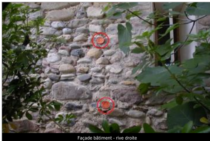
Façade bâtiment - rive droite