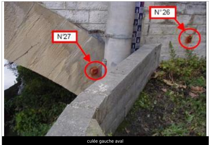
culée gauche aval

Coordonnées WGS84 : X: 2.18486300 / Y: 42.87793300