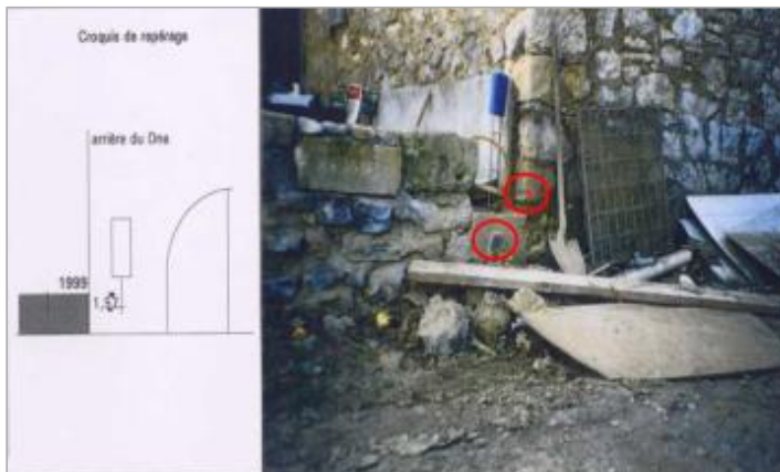
façade arrière du domaine - rive gauche canal