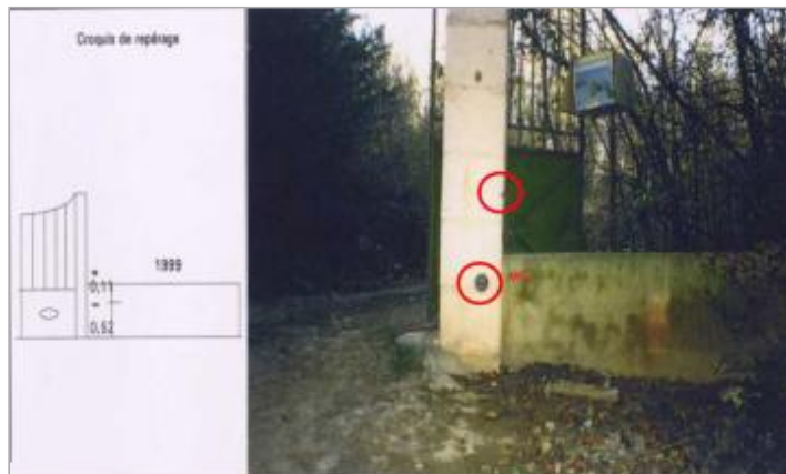
pilier droit de portail - rive droite

Coordonnées WGS84 : X: 3.02812060 / Y: 43.20606500