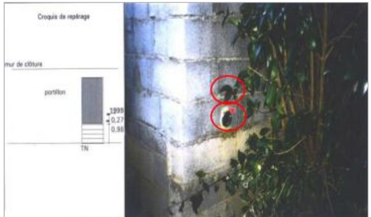
angle des murs d'enceinte - rive droite

Coordonnées WGS84 : X: 3.01553400 / Y: 43.19890600