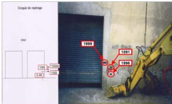
piédroit du portail de la cour - rive droite