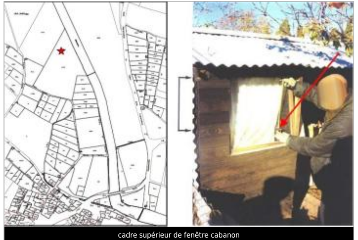
cadre supérieur de fenêtre cabanon