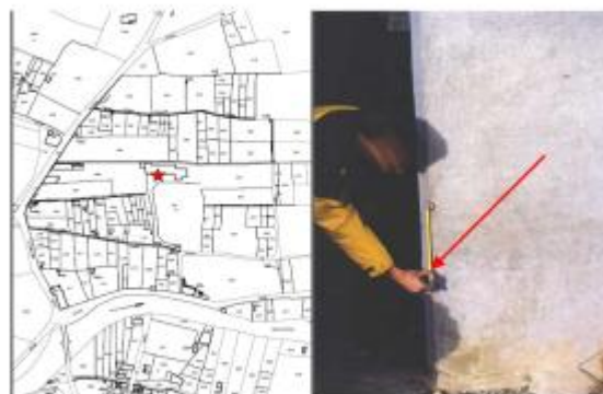
piédroit de portail de hangar - rive gauche