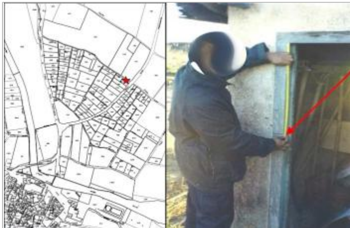
linteau gauche d'entrée cabanon - rive gauche