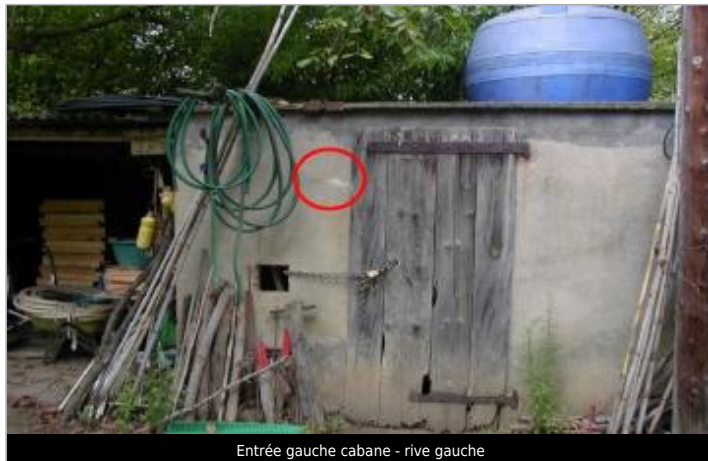
Entrée gauche cabane - rive gauche