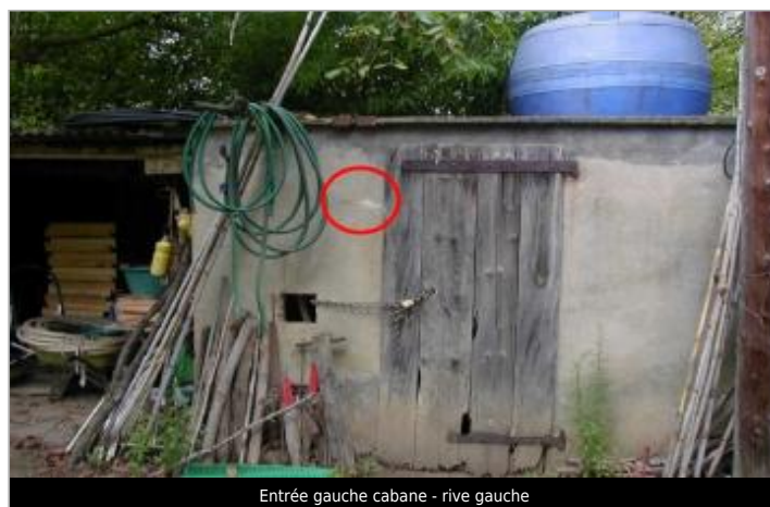
Entrée gauche cabane - rive gauche