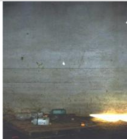
Mur intérieur de la batisse rive droite