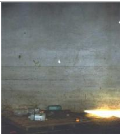
Mur intérieur de la batisse rive droite