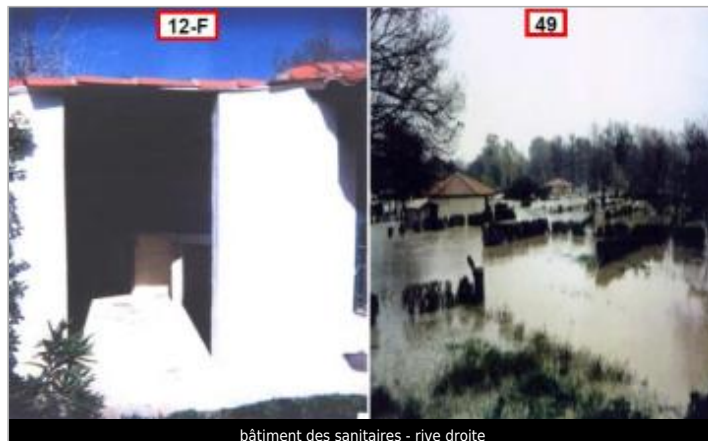
bâtiment des sanitaires - rive droite