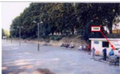
façade du cabanon - rive gauche