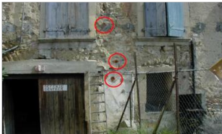
face sud piedroit du portail -rive gauche